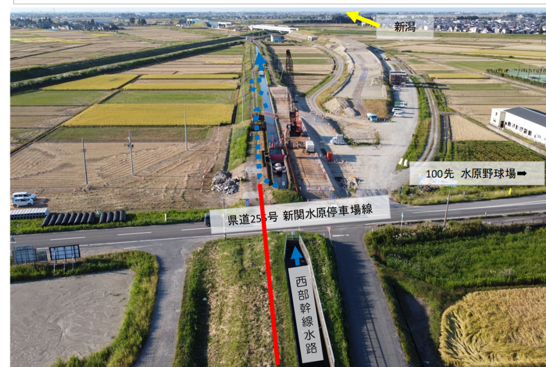
仮水路φ900 第1回施工 赤破線 L=100m 第2回施工 赤線

第1回止水のお願いにて下記航空写真の青点線箇所の仮水路（φ900）を施工し、カルバート工（102mのうち55m完了）を施工しました。残りのカルバート工をするに際し、下記航空写真の赤線箇所の仮水路（φ900）を施工する必要があり、再度、止水をお願い致します。今回、期間が長いのは一部漏水があり、修理が必要になった為です。大変ご迷惑をお掛け致しますが、ご協力をお願い致します。